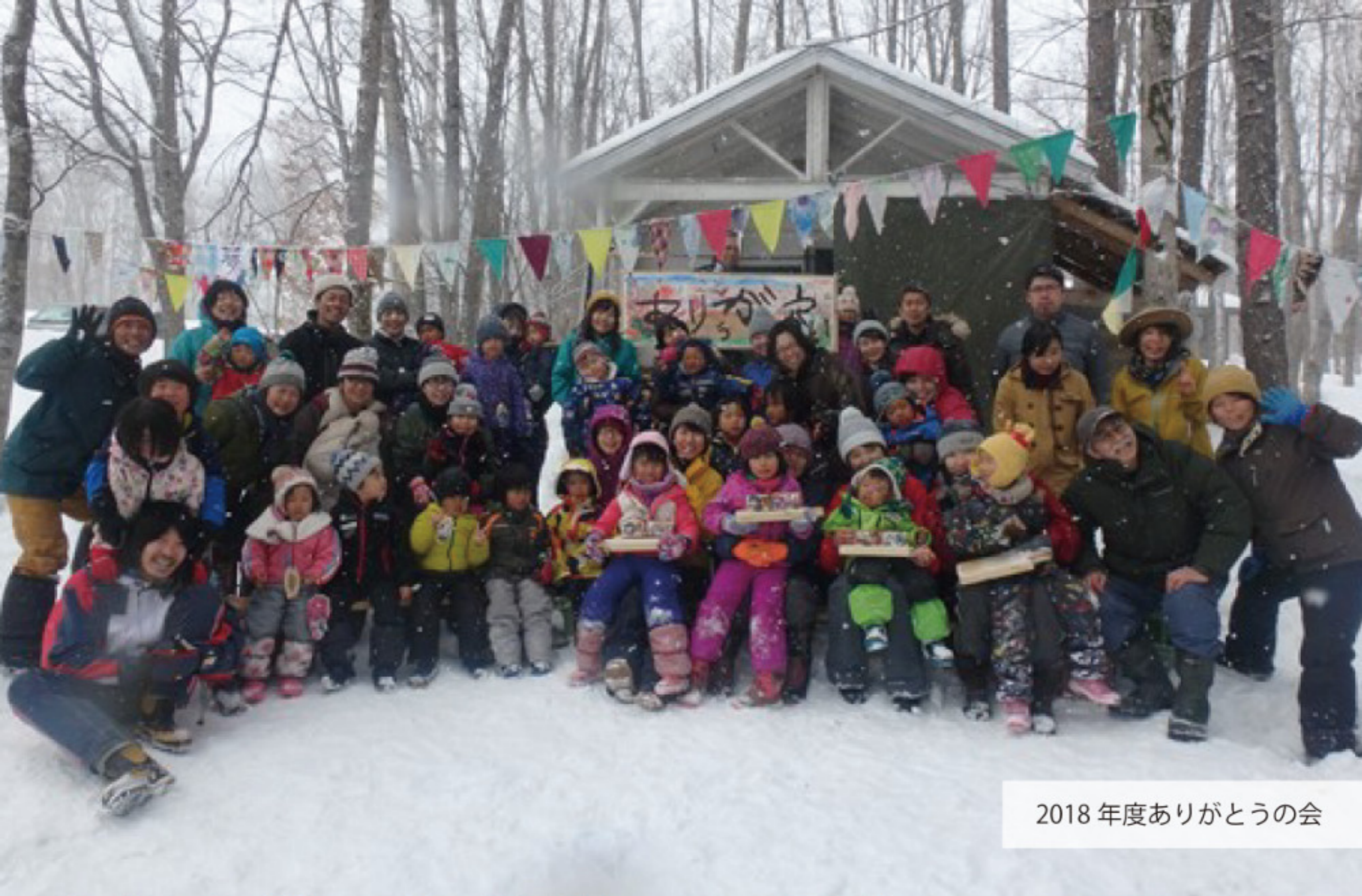
2018 年度ありがとうの会